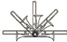
Figura 3: Choros nº 3 (1925), Heitor Villa-Lobos 19